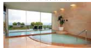
ホワイトシルキーイオンバス(女湯)