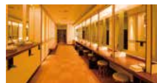
パウダールーム(女湯)

※緊急事態宣言発令、まん延防止重点措置対象区域の場合、 営業時間は20:00まで(最終入館 19:30)となります。