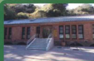
パークセンター 公園の地図や散策コースなどを用意しております。