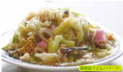
長崎血うどん(イメージ)