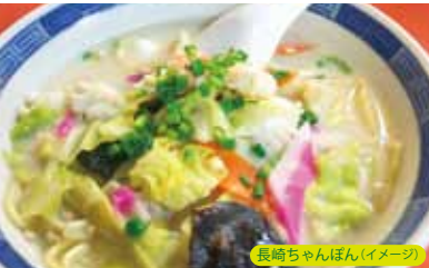
長崎ちゃんぽん(イメージ)

九州には美味しいものグルメが盛りだくさん！ホテルシェフが 横須賀観音崎京急ホテルのアレンジを加えたホテルbuffet 九州の風を感じてください！！