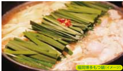
福岡博多もつ鍋(イメージ)