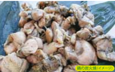
鶏の炭火焼(イメージ)